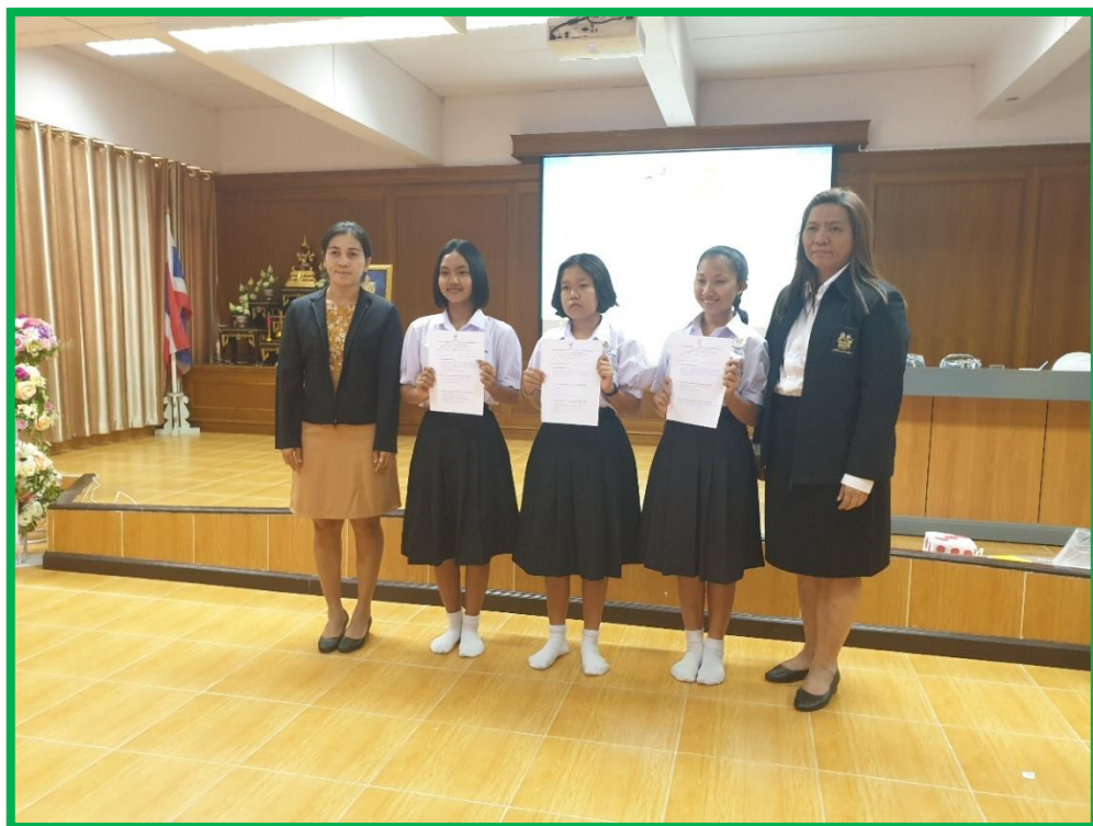
มอบเกียรติบัตรแก่นักเรียนที่ทำหน้าที่ในการร่วมกิจกรรมมอบนมได้อย่างยอดเยี่ยม