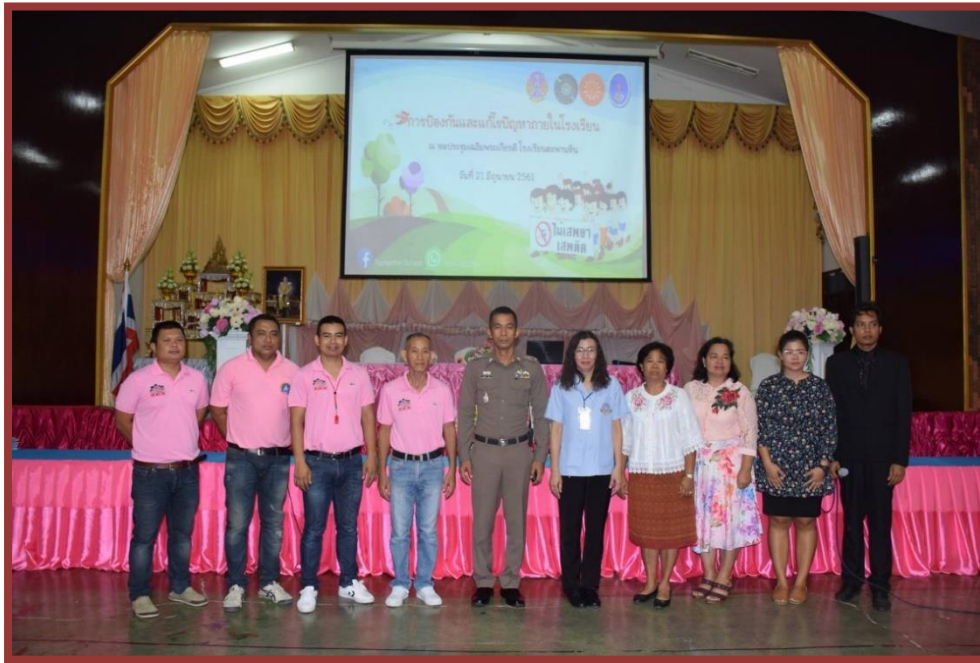
รูปภาพประกอบการอบรม “โครงการแก้ไขปัญหภายในโรงเรียน” วันที่ 21 มิถุนายน 2565 ณ หอประชุมโรงเรียนตะพานหิน