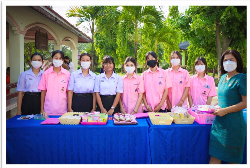
สถานที่ โรงเรียนตะพานหิน วันศุกร์ ที่ 13 เดือนธันวาคม พ.ศ.2564