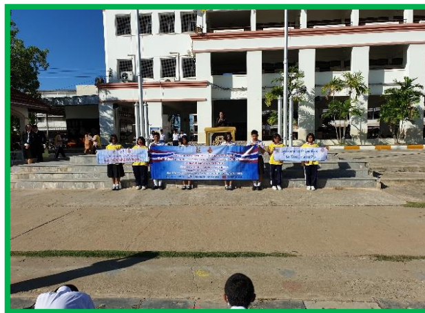
รองผู้อำนวยการเมตตา พลประถม รับมอบป้ายต่อต้านการทุจริต คอร์รัปชันหน้าเสาธง