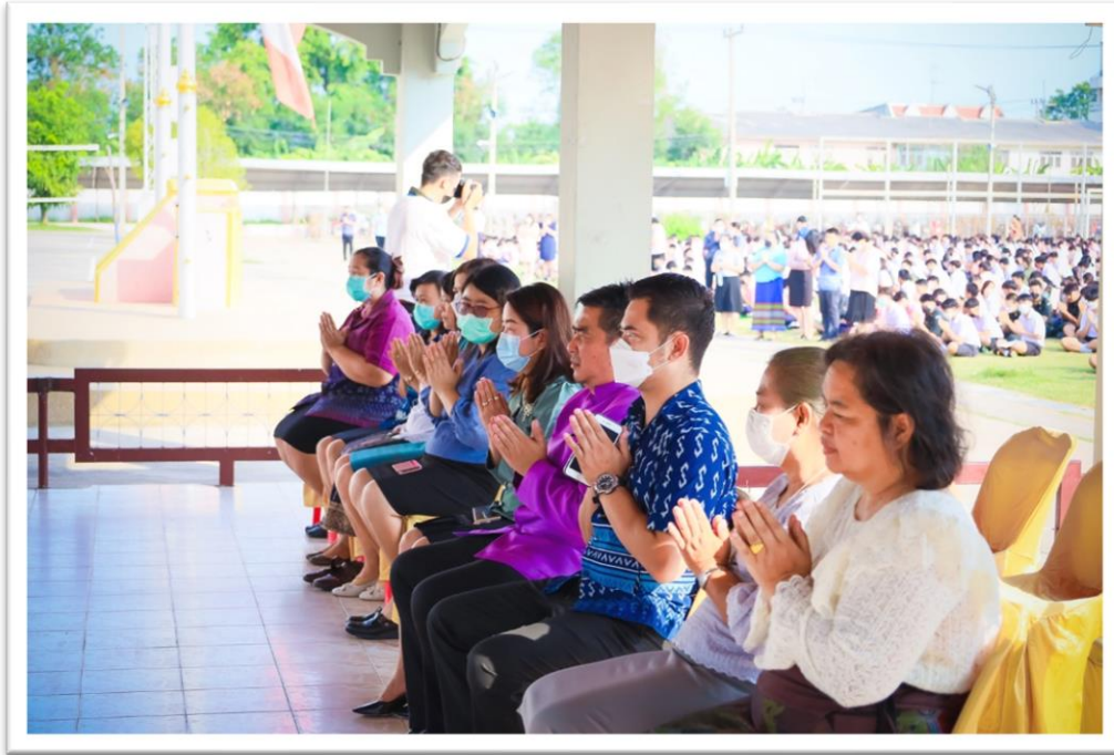
สถานที่ โรงเรียนตะพานหิน วันศุกร์ ที่ 13 เดือน ธันวาคม พ.ศ.2564