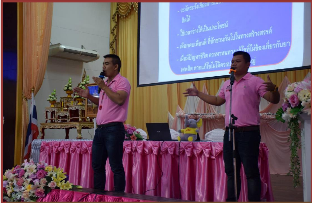
รูปภาพประกอบการอบรม “โครงการแก้ไขปัญหายาในโรงเรียน” วันที่ 21 มิถุนายน 2565 ณ หอประชุมโรงเรียนตะพานหิน