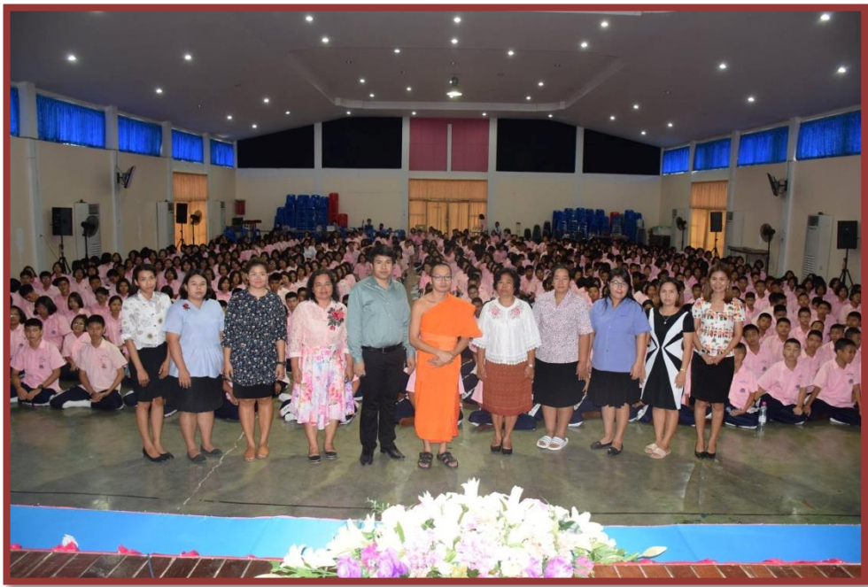
รูปภาพประกอบการอบรม “โครงการแก้ไขปัญหภายในโรงเรียน” วันที่ 21 มิถุนายน 2565 ณ หอประชุมโรงเรียนตะพานหิน