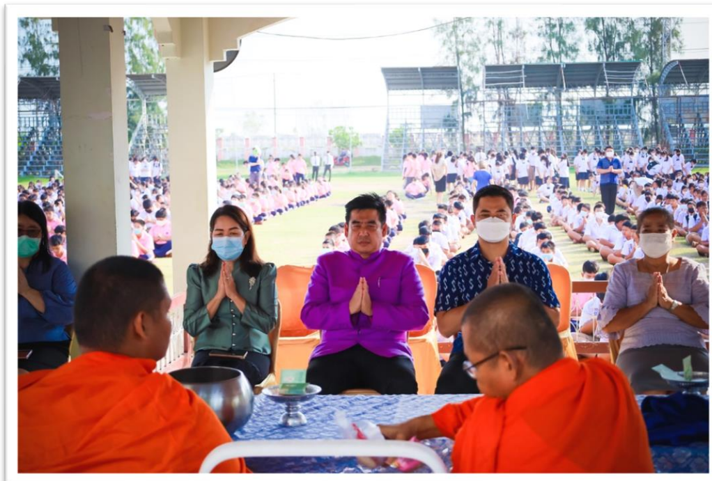
สถานที่ โรงเรียนตะพานหิน วันศุกร์ ที่ 13 เดือนธันวาคม พ.ศ.2564