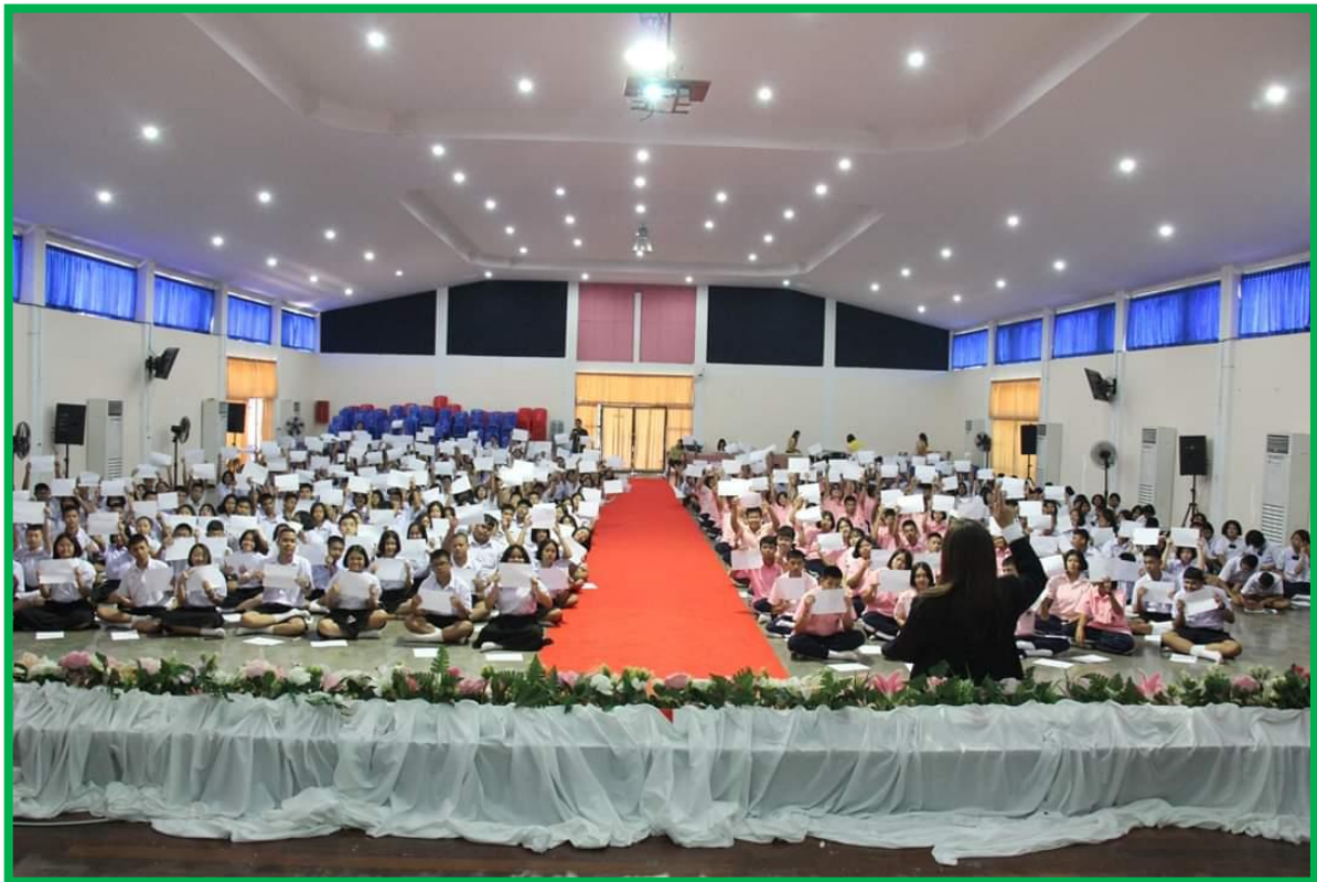
รายละเอียดและการดำเนินงานตามพันธกิจของครอบครัวพอเพียง