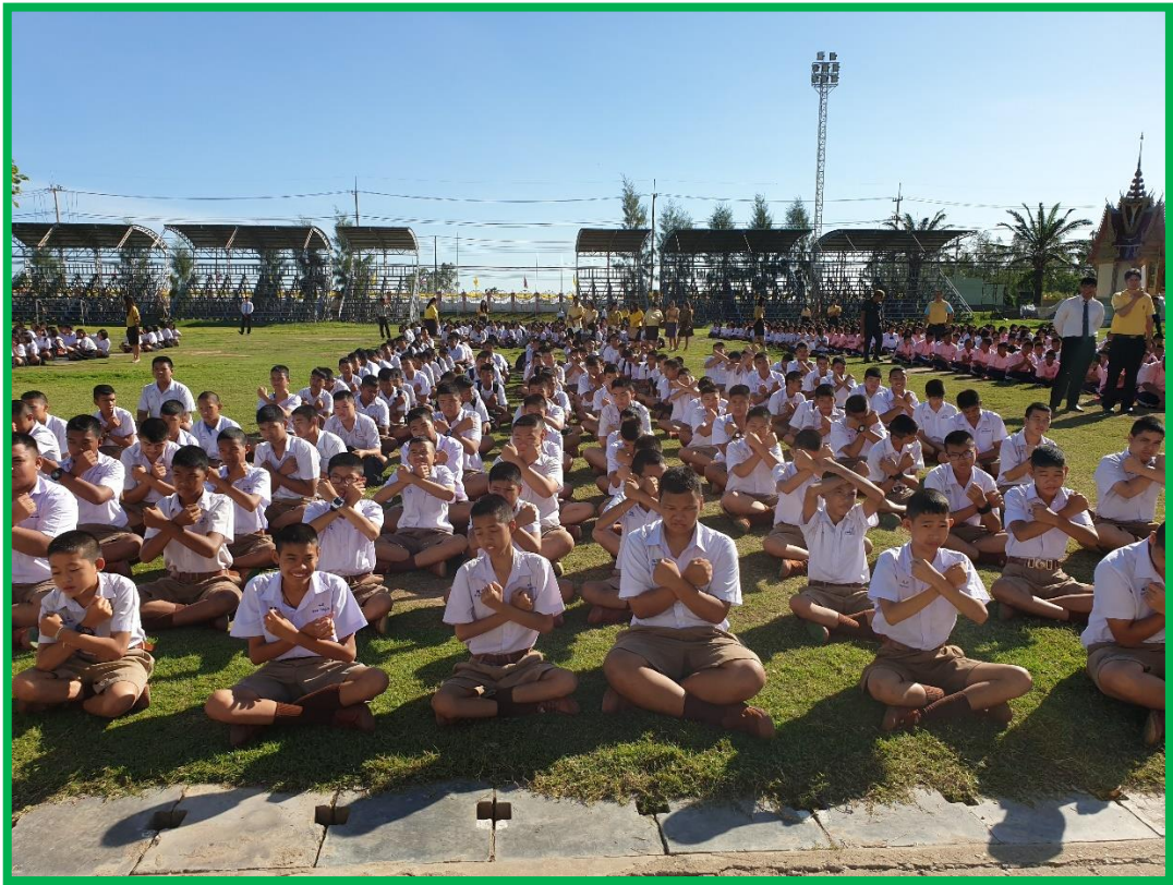
นักเรียนและคณะครูโรงเรียนตะพานหินร่วมกิจกรรมต่อต้านการทุจริตคอร์รัปชันหน้าเสาธง