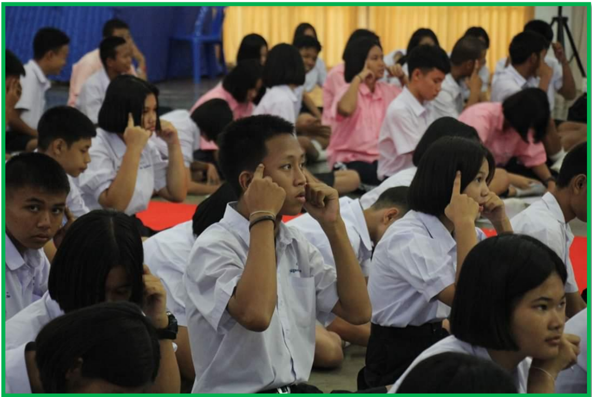
การอบรมเศรษฐกิจพอเพียงและการทรงงาน