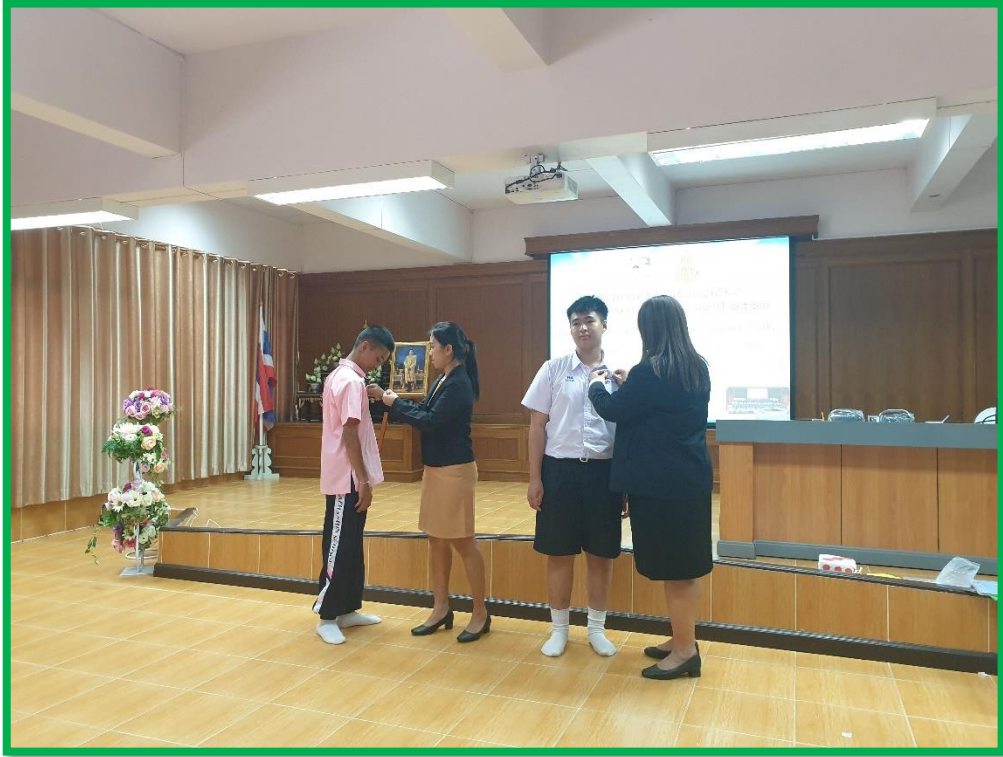
มอบเข็มครอบครัวยุวเพียงแก่ประธานพันธกิจ