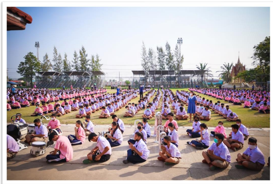
สถานที่ โรงเรียนตะพานหิน วันศุกร์ ที่ 13 เดือนธันวาคม พ.ศ.2564