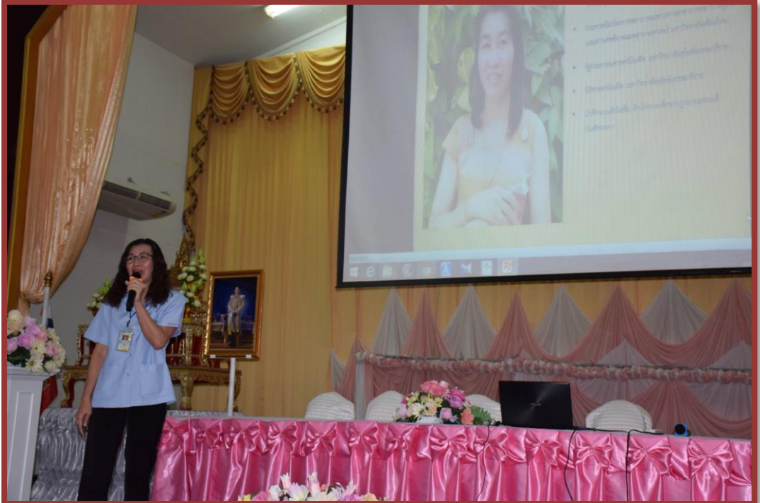
รูปภาพประกอบการอบรม “โครงการแก้ไขปัญหภายในโรงเรียน” วันที่ 21 มิถุนายน 2565 ณ หอประชุมโรงเรียนตะพานหิน