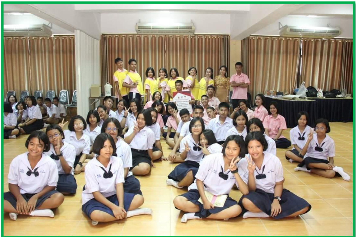
การดำเนินกิจกรรมตามแต่ละพันธกิจ