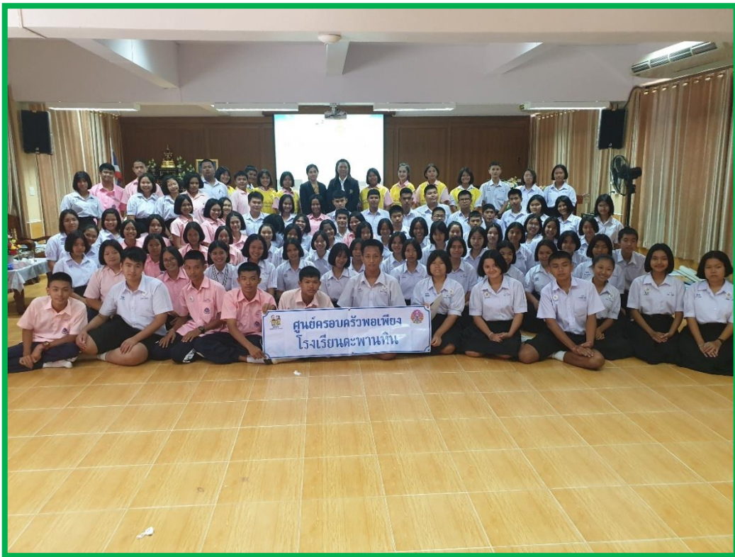
นักเรียน ครูและวิทยากรถ่ายรูปร่วมกันในการปิดการอบรมตามโครงการครอบครัวพอเพียง